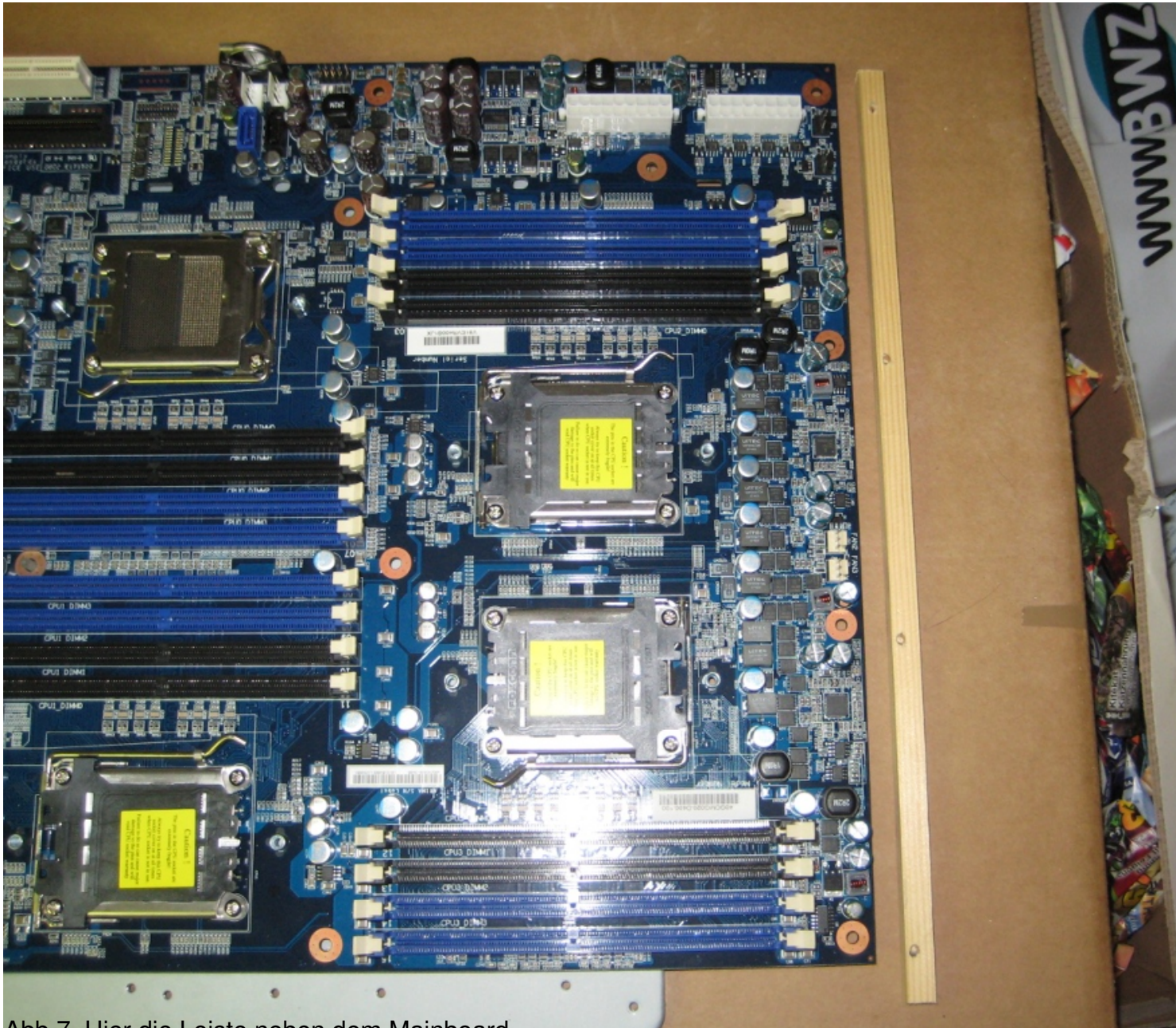
Abb 7. Hier die Leiste neben dem Mainboard