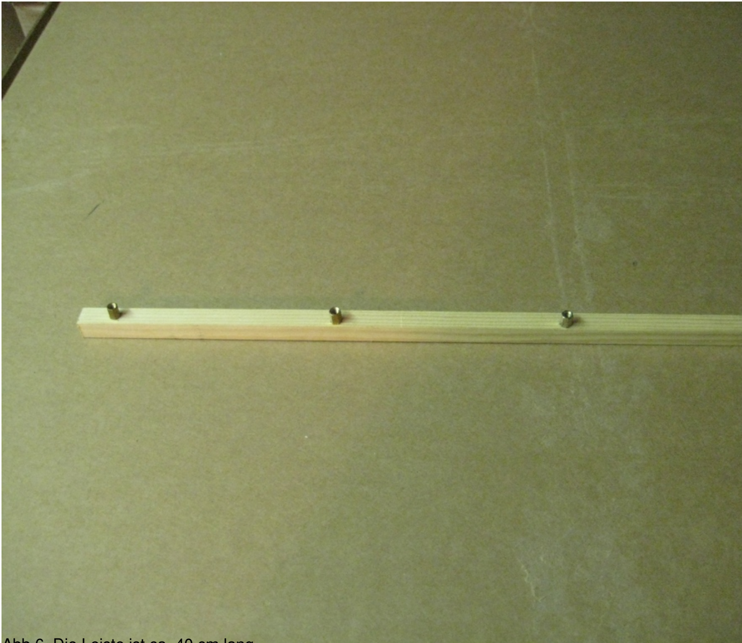
Abb 6. Die Leiste ist ca. 40 cm lang.