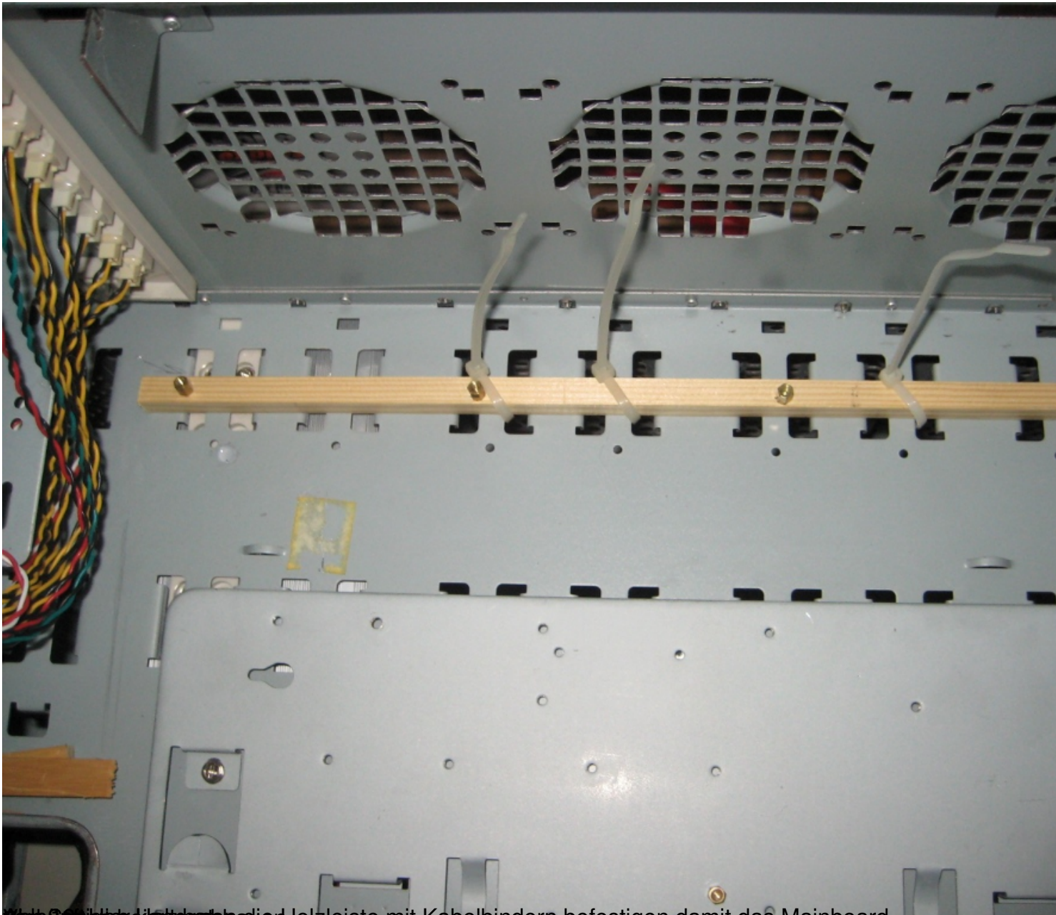
Die Spalte kann man mit einer Holzleiste mit Kabelbindern befestigen damit das Mainboard